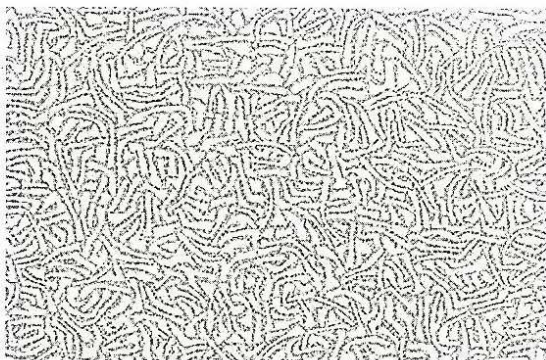
Muestra del paisaje entendido como microcosmos.

Ciertamente, las altas cotas de calidad y de belleza, logradas por el